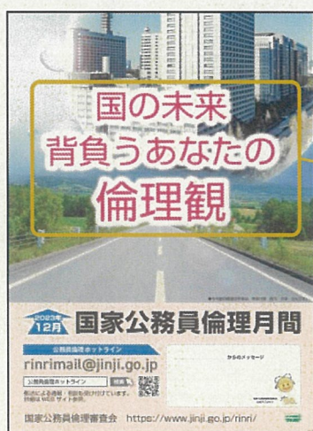
令和5年度職員向け ポスター

公務員倫理への考えや思いを、職員と事業者の方々のそれぞれの立場に沿った標語の形でお寄せください。皆様からのご応募をお待ちしています!!