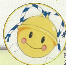
国家公務員倫理審査会 公式マスコット りんりん