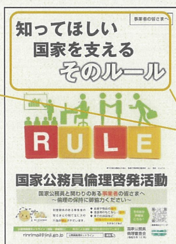
令和5年度事業者向 けポスター