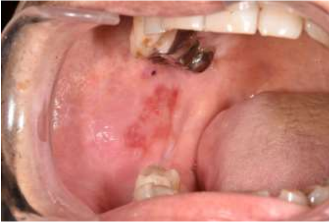
図 2 ニボルマブによる口腔粘膜炎。