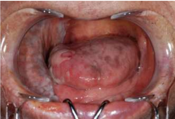
図 7 Cmab+RT（セツキシマブ+放射線）併用療法による口内炎