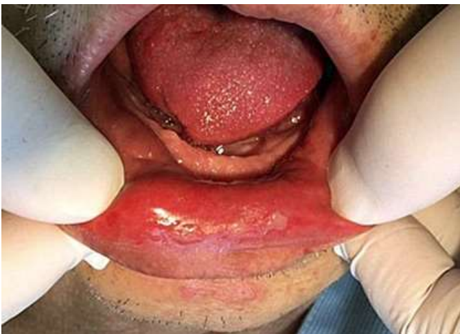
図 5 TPF(ドセタキセル・シスプラチン・フルオロウラシル)療法による口内炎