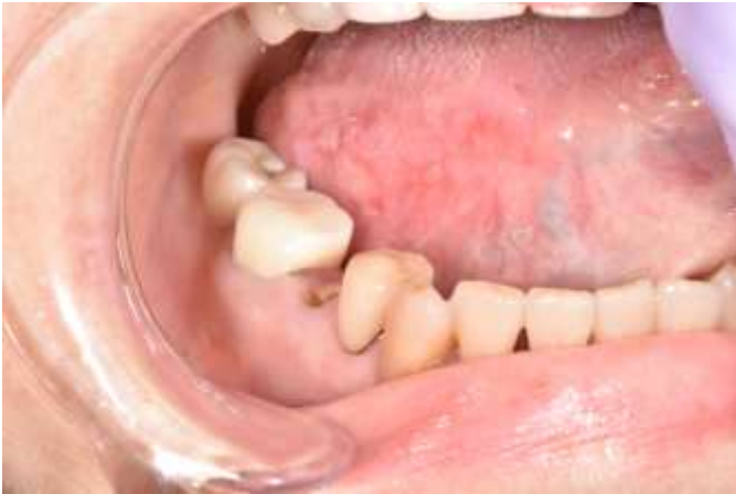
図 1 PCE（パクリタキセル・カルボプラチン・セツキシマブ）療法による舌炎。