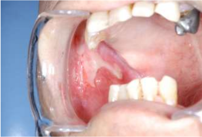
図 4 S-1 による口腔粘膜炎