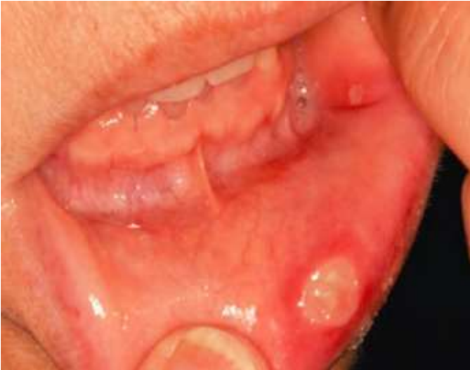
図 6 エベロリムス（mTOR 阻害薬）による口内炎