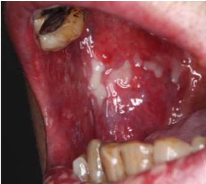
図 8 FP (5-FU+シスプラチン) 併用療法による口内炎