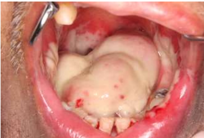
図 9 CCRT (シスプラチン+放射線) 療法による口内炎