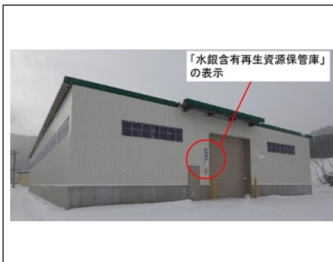
図 2.2 水銀含有再生資源の保管場所の例 1

水銀含有再生資源の保管場所には、水銀含有再生資源を保管していることを表示する必要があります。図 2.2 及び図 2.3 の例のように、水銀含有再生資源であることが一目で分かるよう、文字の色・大きさ等により目立ちやすいものとしてください。また、保管場所は、鍵をかけるか、周囲に堅固な柵を設けることが求められます。