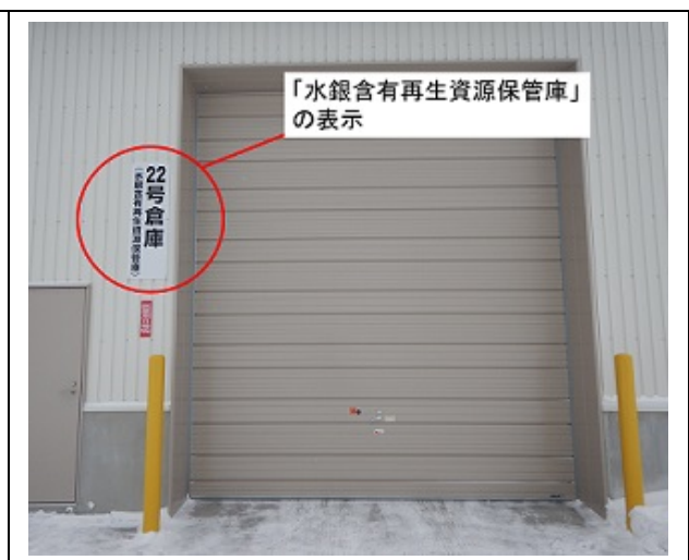
図 2.3 水銀含有再生資源の保管場所の例 2