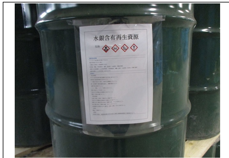
図 2.1 水銀含有再生資源を保管する容器の表示例

なお、労働安全衛生法（昭和 47 年法律第 57 号）に基づく特定化学物質障害予防規則（昭和 47 年労働省令第 39 号）第 25 条第 2 項の規定により、水銀、水銀の無機化合物（硫化水銀を除く。）又はアルキル水銀化合物（アルキル基がメチル基又はエチル基である物に限る。）の含有量が 1 重量パーセントを超える製剤その他の物については、容器の見やすい箇所に物質の名称及び取扱い上の注意事項を表示することも必要です。