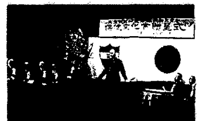
第1回保健文化賞贈呈式

【お問合せ】第一生命保険株式会社 DSR推進室 〒100-8411 東京都千代田区有楽町1-13-1